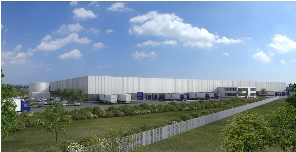
Neubau für die Rudolph Logistik Gruppe, Mamming, Bayern, 30.000 qm Logistikfläche, Fertigstellung Anfang 2015

Investition: Einzelobjekt ab EUR 5 Mio. Portfolios bis EUR 100 Mio.