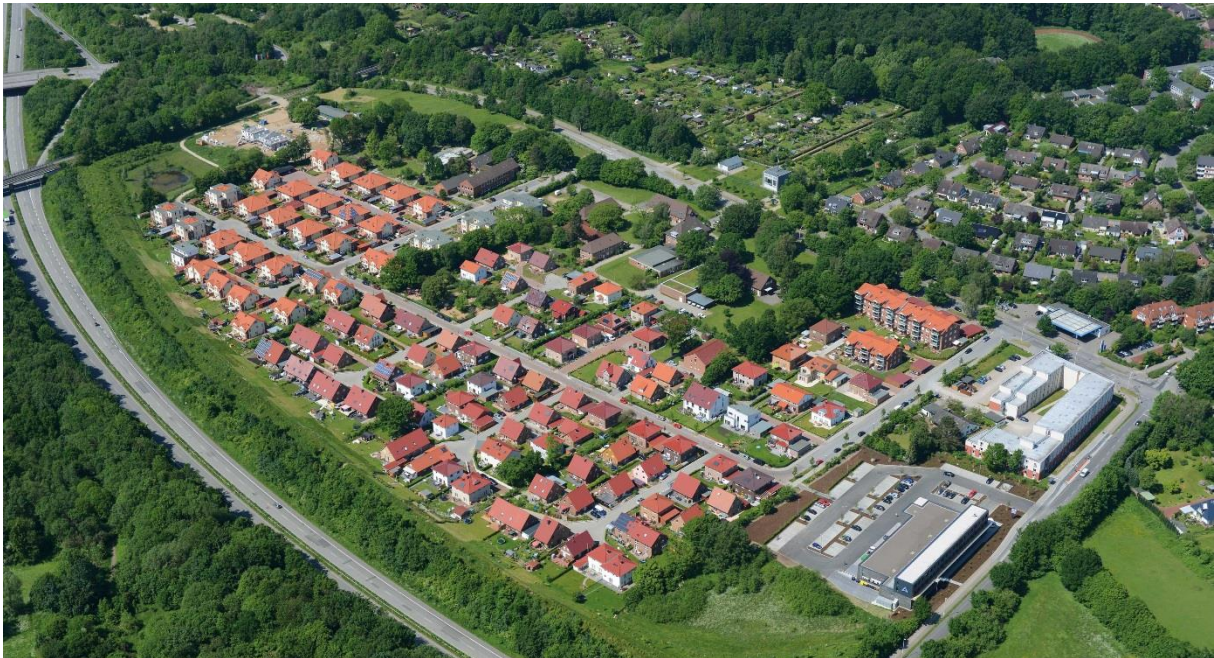
Neubaugebiet am Anneliese-Pinn-Weg / Steenbeker Weg in Kiel, 200 Wohneinheiten+ Aldi-Markt, Fertigstellung Mitte 2014

Beispiele: innerstädtische, industrielle Konversionsflächen, militärische Konversionsflächen, Bauerwartungsland