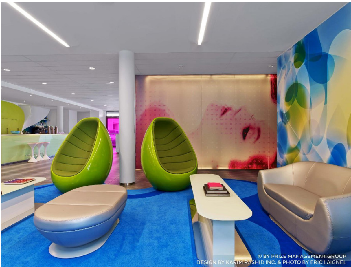
Lobbybereich prizeotel Hamburg-City, Eröffnung Mitte 2014, 218 Zimmer